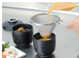
茶碗蒸し作りでとき卵がきれいにこせ、 まろやかアップ